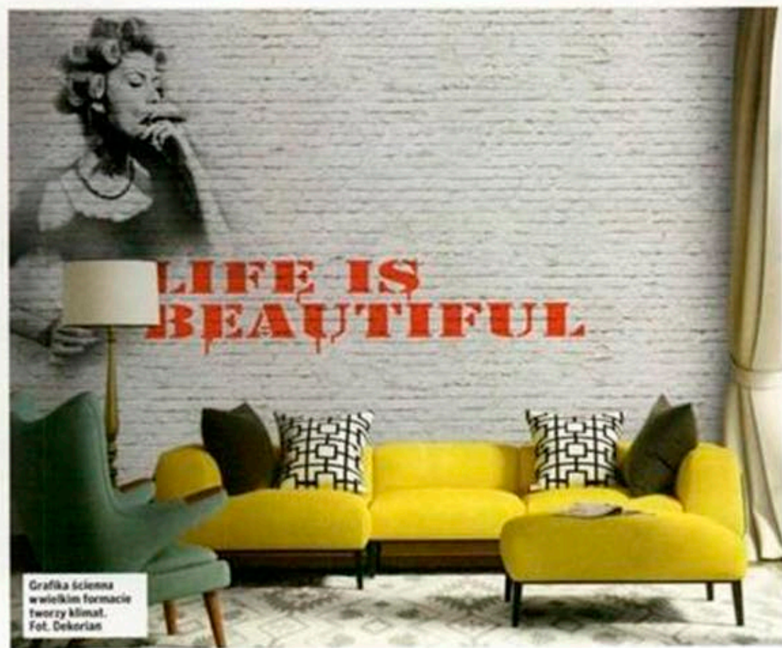
Grafika ścienna w wielkim formacie tworzy klimat.