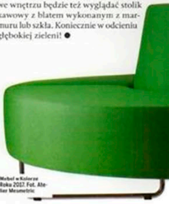
Mebel w kolorze Roku 2017. Fot. Atelier Mesmetric