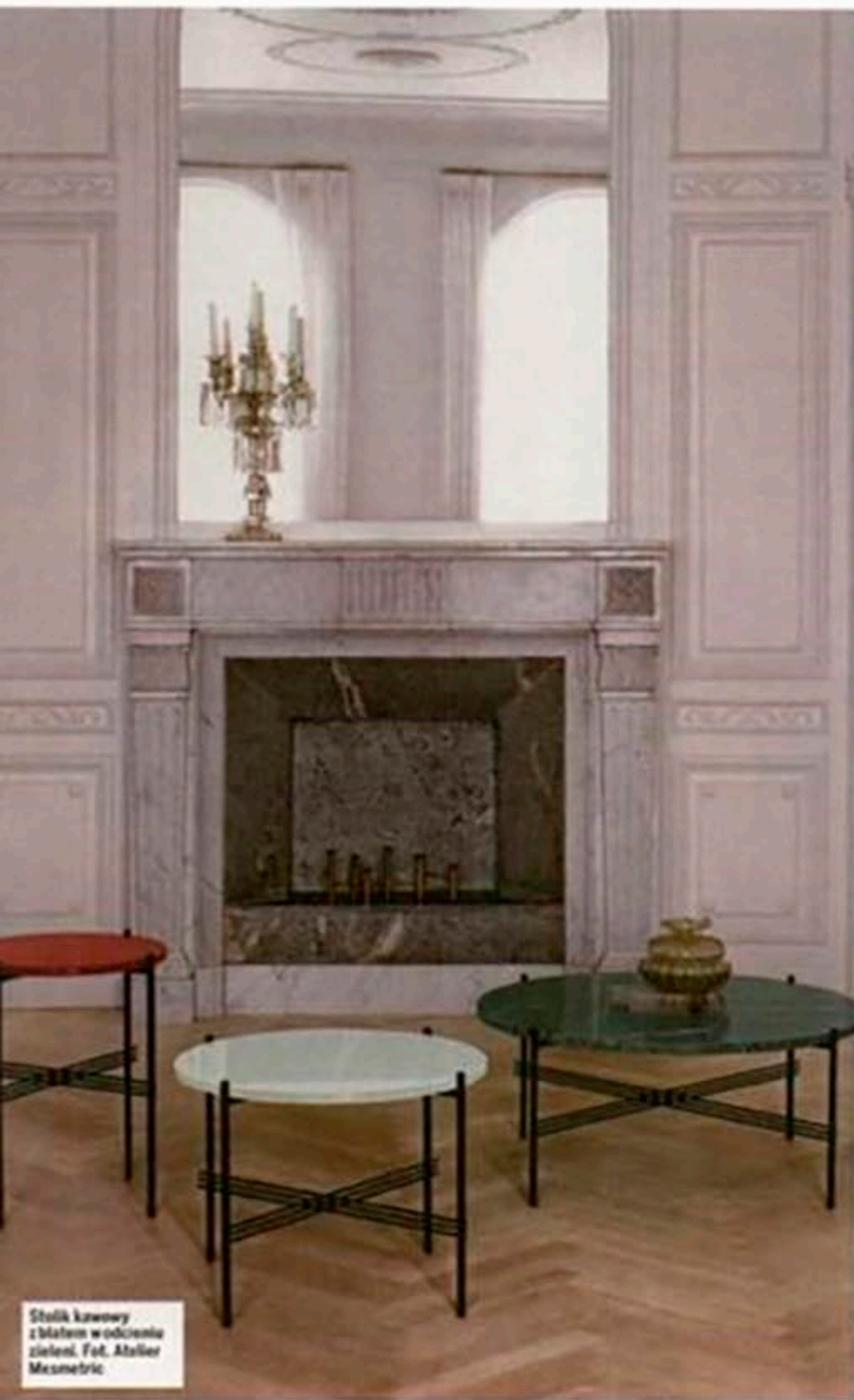
Stolik kawowy z blatem w odcieniu zieleni.