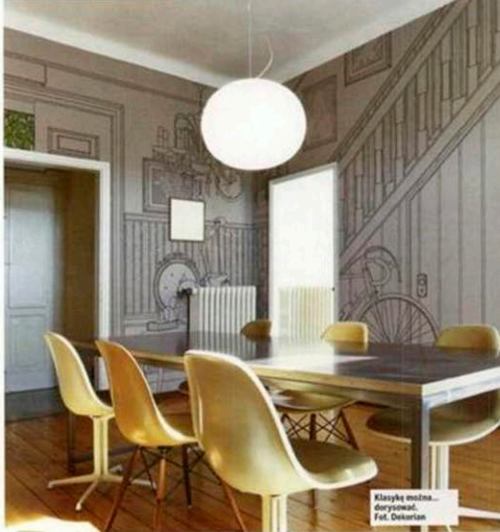
Klasykę można dorysować.

Warszawska architekt wnętrz Anna Koszela uważa, że stylizyka wnętrza biurowego powinna być ponadczasowa i sprofilowana pod kątem rodzaju działalności firmy. – Inne wymagania stawia projektowanie kancelarii prawnej z długoletnią tradycją, a zupełnie inaczej trzeba podejść do aranżacji siedziby młodej firmy z sektora IT – mówi Koszela. Podkreśla jednak, że wspólnym mianownikiem jest zastosowanie najwyższej klasy materiałów wykończeniowych i wyposażenia. – Urządzenie biura jest inwestycją na wiele lat, a przestrzenie biurowe są mocno eksploatowane. Wszelkie kompromisy w tym zakresie mogą więc przynieść oplakane skutki. Podczas aranżacji biura nie zapomnijmy o funkcjonalnym zaaranżowaniu przestrzeni socjalnej, która wpłynie nie tylko na komfort pracy pracowników, ale również porządek w innych pomieszczeniach firmowych – mówi Anna Koszela. ●