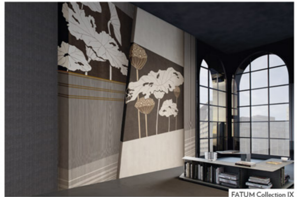
FATUM Collection IX

CROSSING OVER THE CONFINES OF INTERIOR DECORATION, PAST THE KNOWN DESIGN PATHS, CONSTANTLY PURSUING NEW RESULTS THIS IS THE APPROACH WITH WHICH GLAMORA HAS MADE ITS WAY INTO THE WORLD OF WALLPAPERS, DEFINING A NEW GOAL WITH GLAMFUSION™