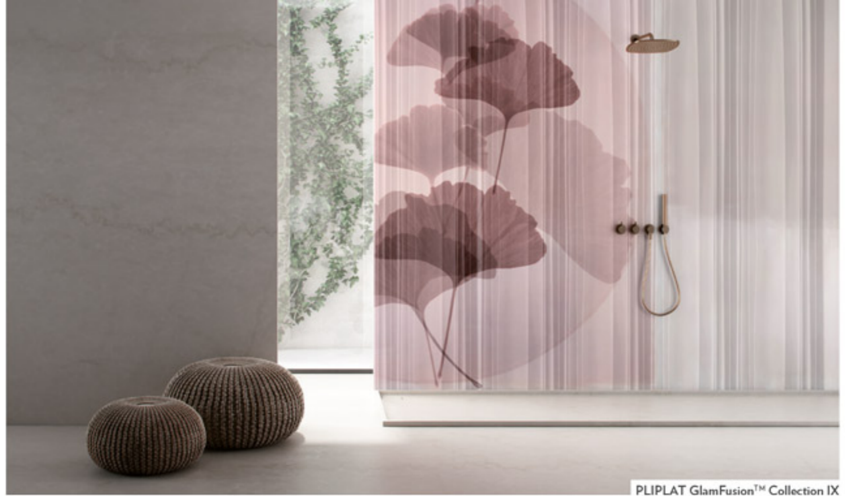
PLIPLAT GlamFusion™ Collection IX

Contacts contact@glamora.it www.glamora.it